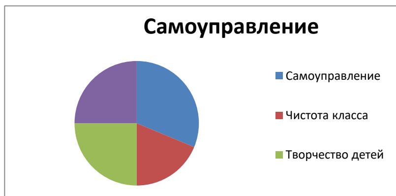
Рисунок 6 - Результаты