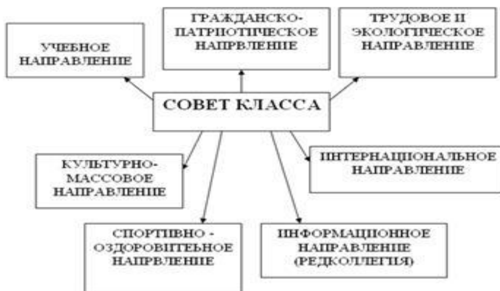
Рисунок 3 – Схема управления в классе

Базисный уровень «Ученическое самоуправление в классах».