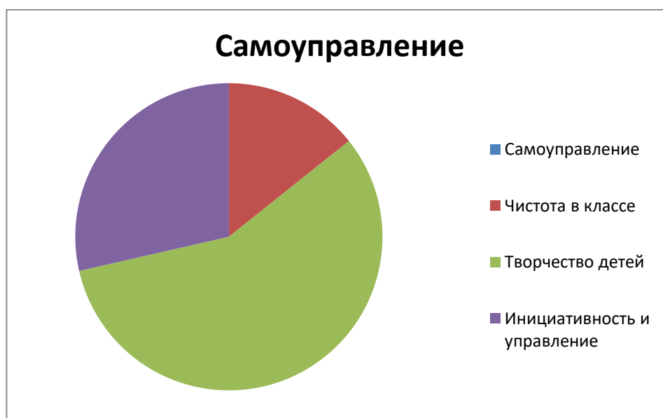
Рисунок 2 - Состояние класса до начала эксперимента

В диаграмме показано, что самоуправление в классе не вводилось, а большую часть работы: организация мероприятий, поддержка чистоты и осуществление контроля проводилось учителем, однако видно, что дети готовы выражать свои мысли и творчество.