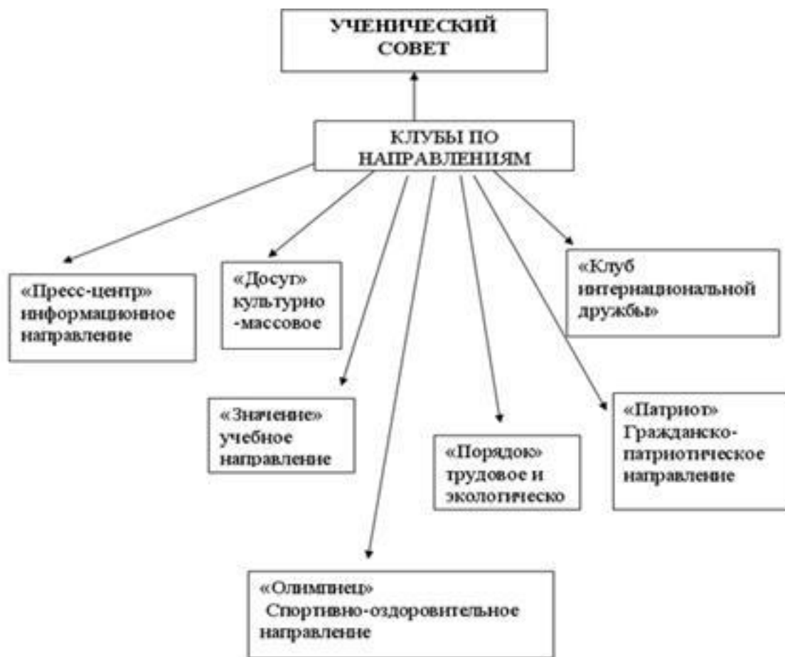
Рисунок 4 – Структура Ученического совета